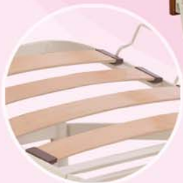
Sommier lattes bois