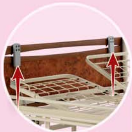
2 télécommandes pour un réglage indépendant du relève-buste et du relève-jambes