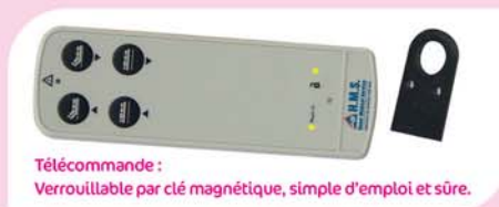
Télécommande : Verrouillable par clé magnétique, simple d'emploi et sûre.