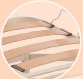
Sommier lattes bois