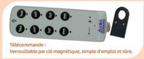
Télécommande : Verrouillable par clé magnétique, simple d'emploi et sûre.

AVANTAGES PRODUIT Fiable et confortable Léger et facile à installer Simple d'emploi et d'entretien