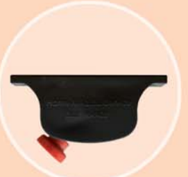
Easyclic assure facilement et en toute sécurité la liaison entre le sommier et le croisillon