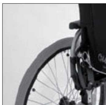
MD 10 Dossier inclinable rabattable sur l'assise