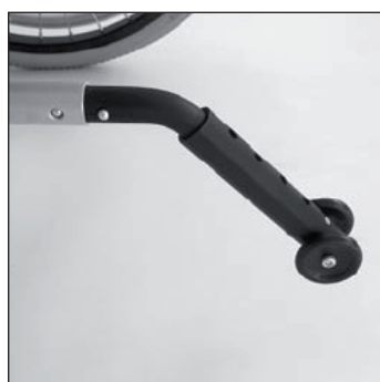
MA 55 Anti bascule simple

Indications sans le coussin d'assise par 0° d'inclinaison d'assise. Inclinaison d'assise maximale s'élève à 3,5 cm.