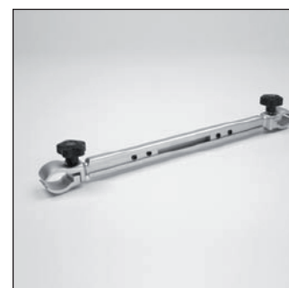
MZ 54 Kit de montage clinique*