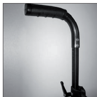
MD 52 Poignées accompagnateur réglables en hauteur