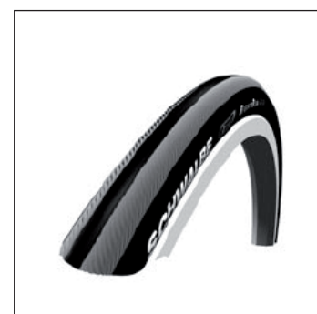
MG 24 Roue arrière 24" avec pneu profil fin largeur 24 x 1