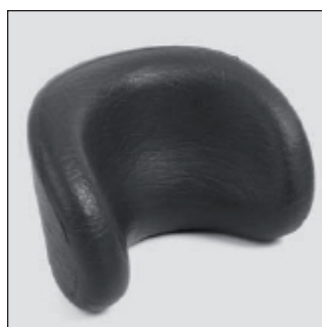
MZ 53 Appui-tête*