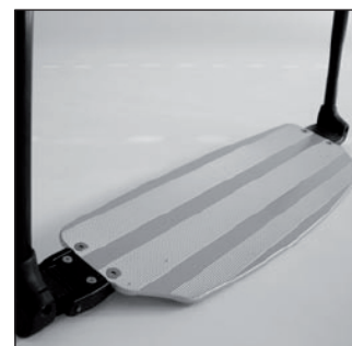
MB 03 Palette repose-pieds monobloc

* Pour tout autre modèle d'accessoires, veuillez vous reporter à la page 165 du catalogue.