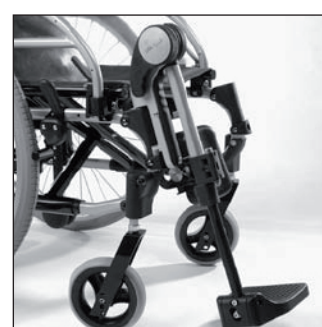
MB 15 Repose-Jambes*