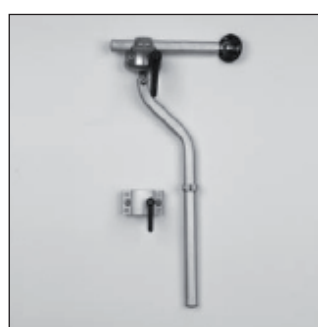
MZ 55 Set de montage Appui-tête*