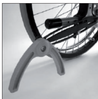
MA 62 Anti bascule pendulaire